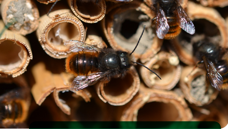
Wild lebende Verwandte der Honigbiene: Mauerbienen zählen zu den häufigsten Bewohnern des Nützlingshotels.