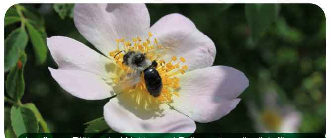
In offenen Blüten sind Nektar und Pollen gut zugänglich für Wildbienen und andere Insekten.

Ein vom Frühjahr bis zum Herbst vielfältig blühender Garten versorgt die Bewohner des Nützlingshotels mit Nahrung. Besonders geeignet sind Korbblütler, Schmetterlingsblütler, Kreuzblütler, Lippenblütler, Weiden und Obstbäume.