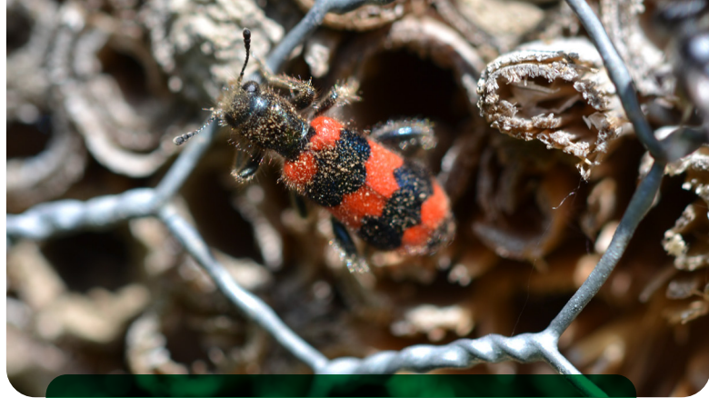
Der Immenkäfer ist ein Nestparasit, der den Bruterfolg der Wildbienen reduzieren kann.

Die Wildbienenlarve verpuppt sich nach etwa 4 Wochen und verbringt im Schutze dieses Gespinnstes den Winter in der Röhre. Im nächsten Jahr schlüpft die fertige Biene.