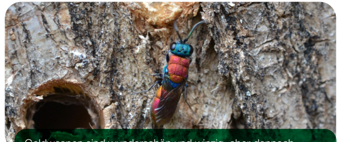
Goldwespen sind wunderschön und winzig, aber dennoch gefräßige Räuber am Wildbienenhotel.

Kuckucksbienen, Goldwespen, Schlupfwespen oder Taufiegen treten als Nestparasiten auf. Ihre Brut ernährt sich von den Wildbienenlarven. Spechte, Meisen und andere Vögel haben ebenfalls das Nützlingshotel als Futterplatz entdeckt. Sie picken die Hölzer auf und ziehen die besiedelten Stängel heraus, um die Bienenlarven zu fressen. Ein Vogelschutzgitter kann die Larven schützen, aber auch die Fraßfeinde haben ein Recht zu leben, zumal sie häufig ebenfalls selten sind.